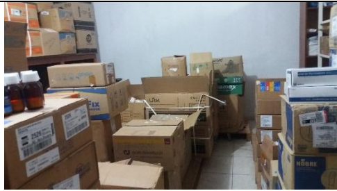
Foto 07 – Armazenamento inadequado por falta de espaço – Farmácia Municipal - Data: 21/09/2017