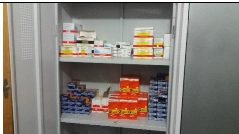
Foto 20 – Armazenamento dos Medicamentos Controlados – Farmácia Municipal - Data: 21/09/2017