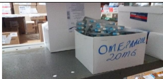
Foto 12 – Detalhes do Armazenamento de Medicamentos – Farmácia Municipal - Data: 21/09/2017