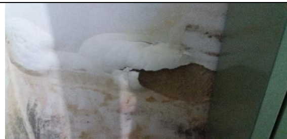
Foto 27 – Detalhes do Péssimo Estado de Conservação da Parede da Farmácia Municipal – Farmácia Municipal - Data: 21/09/2017