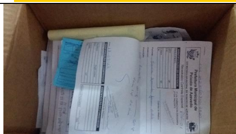
Foto 33 – Sistema Inadequado de Arquivamento das Receitas de Fornecimento de Medicamentos