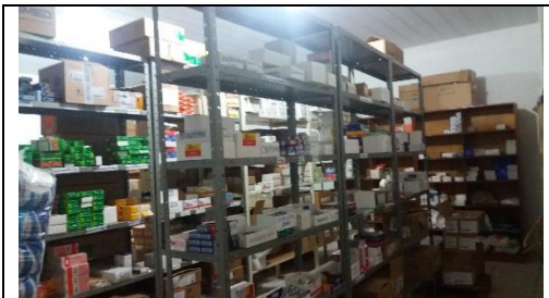
Foto 03 – Farmácia Municipal - Disposição do Estoque de Medicamentos - Data: 21/09/2017