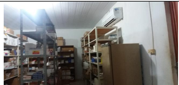
Foto 02 – Farmácia Municipal - Estoque de medicamentos e materiais - Data: 21/09/2017