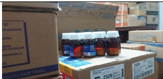
Foto 10 – Armazenamento inadequado por falta de espaço – Farmácia Municipal - Data: 21/09/2017