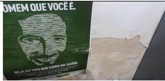
Foto 25 – Detalhes Péssimo Estado de Conservação da Parede da Farmácia Municipal – Farmácia Municipal - Data: 21/09/2017