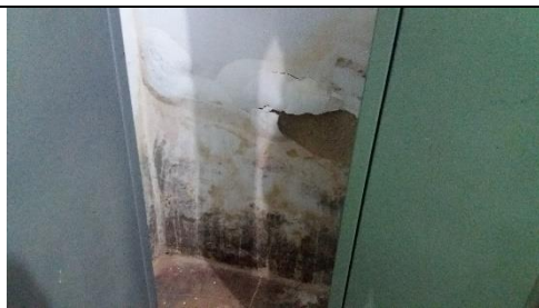
Foto 29 – Detalhes do Péssimo Estado de Conservação da Parede da Farmácia Municipal - Data: 21/09/2017