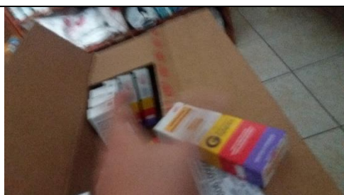
Foto 13 – Detalhes do Armazenamento de Medicamentos – Farmácia Municipal - Data: 21/09/2017