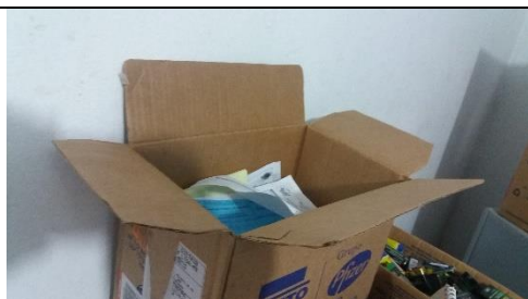
Foto 31 – Sistema Inadequado de Arquivamento das Receitas de Fornecimento de Medicamentos - Data: 21/09/2017