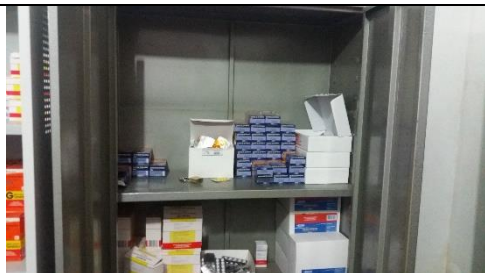
Foto 22 – Armazenamento dos Medicamentos Controlados – Farmácia Municipal - Data: 21/09/2017