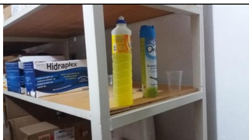
Foto 11 – Presença de produto de limpeza próximo a medicamentos – Farmácia Municipal - Data: 21/09/2017