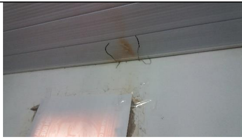
Foto 24 – Detalhes da Parede e Forro da Farmácia Municipal – Farmácia Municipal - Data: 21/09/2017