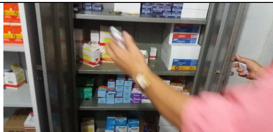
Foto 23 – Armazenamento dos Medicamentos Controlados – Farmácia Municipal - Data: 21/09/2017