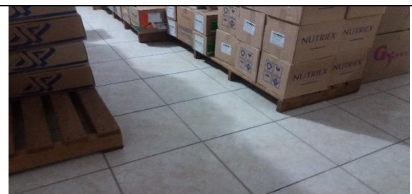
Foto 06 – Detalhes do Armazenamento – Trados com distância inadequada em relação ao chão – Farmácia Municipal - Data: 21/09/2017