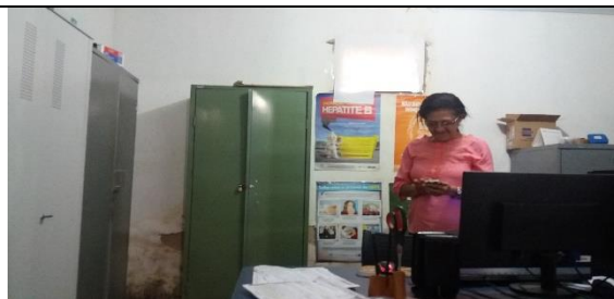
Foto 19 – Detalhes do Péssimo Estado de Conservação da Parede da Farmácia Municipal - Data: 21/09/2017