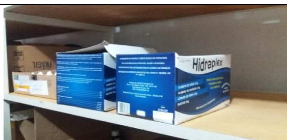
Foto 14 – Detalhes do Armazenamento de Medicamentos – Farmácia Municipal - - Data: 21/09/2017