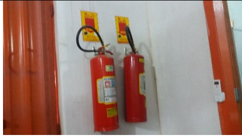
Foto 15 – Equipamentos de Segurança – Farmácia Municipal - - Data: 21/09/2017