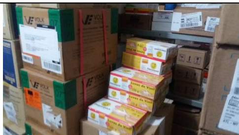
Foto 09 – Armazenamento inadequado não há espaço para circulação de ar – Farmácia Municipal - Data: 21/09/2017