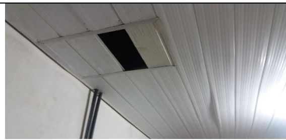
Foto 30 – Detalhes do Forro com Frestas Permitindo a Entrada de Insetos – Farmácia Municipal - Data: 21/09/2017