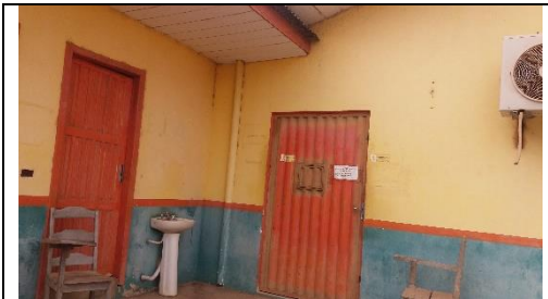
Foto 01 – Porta de Acesso à Farmácia Básica – Local de Distribuição de Medicamentos - Data 21/09/2017

b.7) Condições de Armazenagem Inadequadas dos medicamentos (Acórdão 476/2011 – Plenário), conforme evidenciado a seguir: