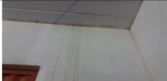
Foto 16 – Detalhes de Forros e Paredes – Farmácia Municipal - Data: 21/09/2017