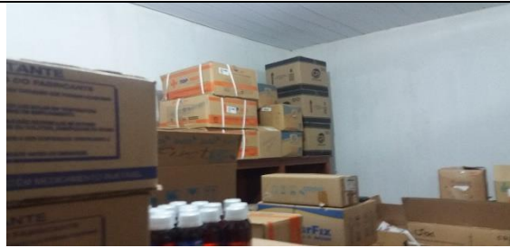
Foto 08 – Armazenamento inadequado por falta de espaço – Farmácia Municipal - Data: 21/09/2017