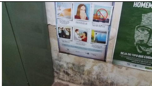
Foto 26 – Detalhes de bolores, Mofos na Parede da Farmácia Municipal – Farmácia Municipal - Data: 21/09/2017