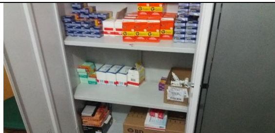
Foto 21 – Armazenamento dos Medicamentos Controlados – Farmácia Municipal - Data: 21/09/2017